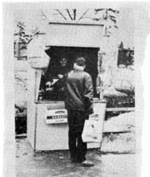
Ärktör i samtal med intagningsmyndigheten